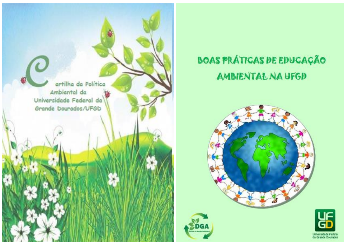
Figuras 6 e 7: Cartilhas de comunicação e educação ambiental.

Visando a sensibilização e a conscientização do cidadão sobre a responsabilidade socioambiental, foram elaboradas duas cartilhas, uma intitulada “Boas Práticas de Educação Ambiental na UFGD” (Figura 6) e outra “Política Ambiental da UFGD” (Figura 7).