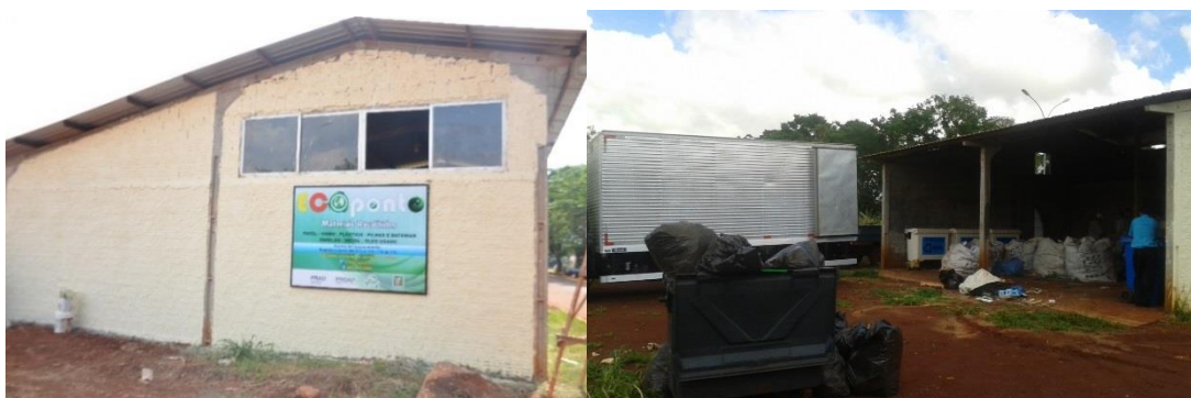
Figuras 8 e 9: Eco ponto localizado na Unidade II.

Em outubro de 2014 iniciou-se o funcionamento do Eco ponto, na unidade II, onde são depositados resíduos recicláveis da UFGD e os resíduos trazidos pela comunidade acadêmica, produzidos em suas residências. Recolheu-se a cada mês quase 800 quilos de resíduos, que após segregados, foram encaminhados para doação a Associação de Agentes Ecológicos de Dourados (AGECOLD).