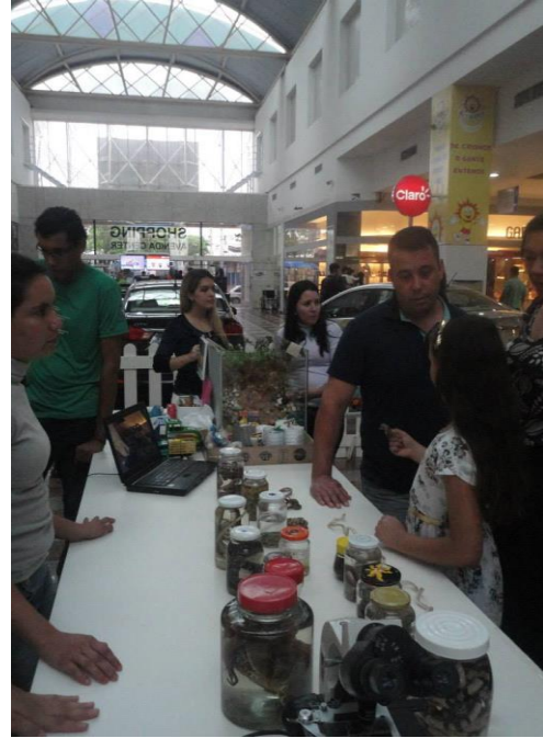
Figuras 3 e 4: Ações da “Exposição sobre a Biodiversidade e Gestão de Resíduos Sólidos”.