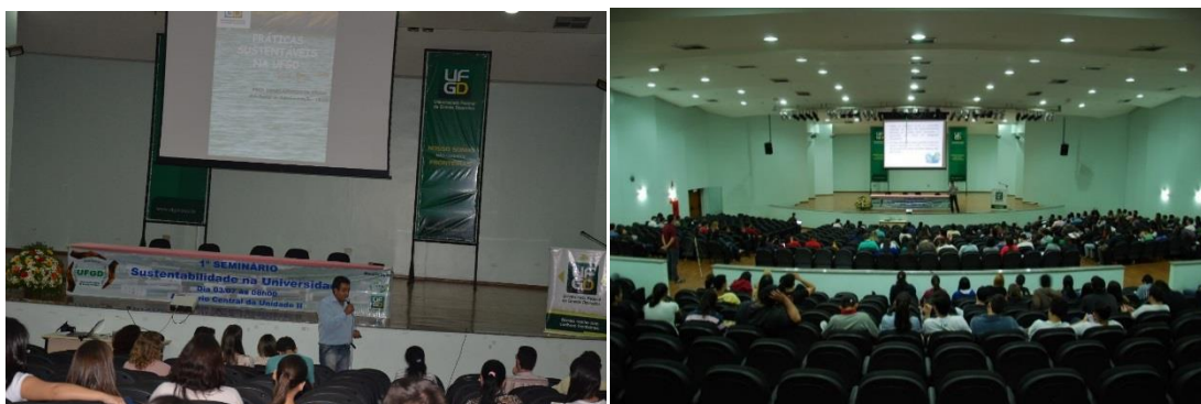
Figuras 1 e 2: Seminário de Sustentabilidade na Universidade, realizado em 2014 na UFGD.

Sabe-se que uma universidade ambientalmente responsável, e como tal, sustentável, deve promover de forma constante as vertentes possíveis da ambientalização e sua integração num todo sinérgico, coerente, e gerador de resultados efetivos para a sustentabilidade planetária: não apenas os resultados relativos. Diante disto, ficou decidido que, uma vez por ano, as instituições de ensino superior da Grande Dourados devem se reunir para discutir estratégias, de modo a atingir estes objetivos.