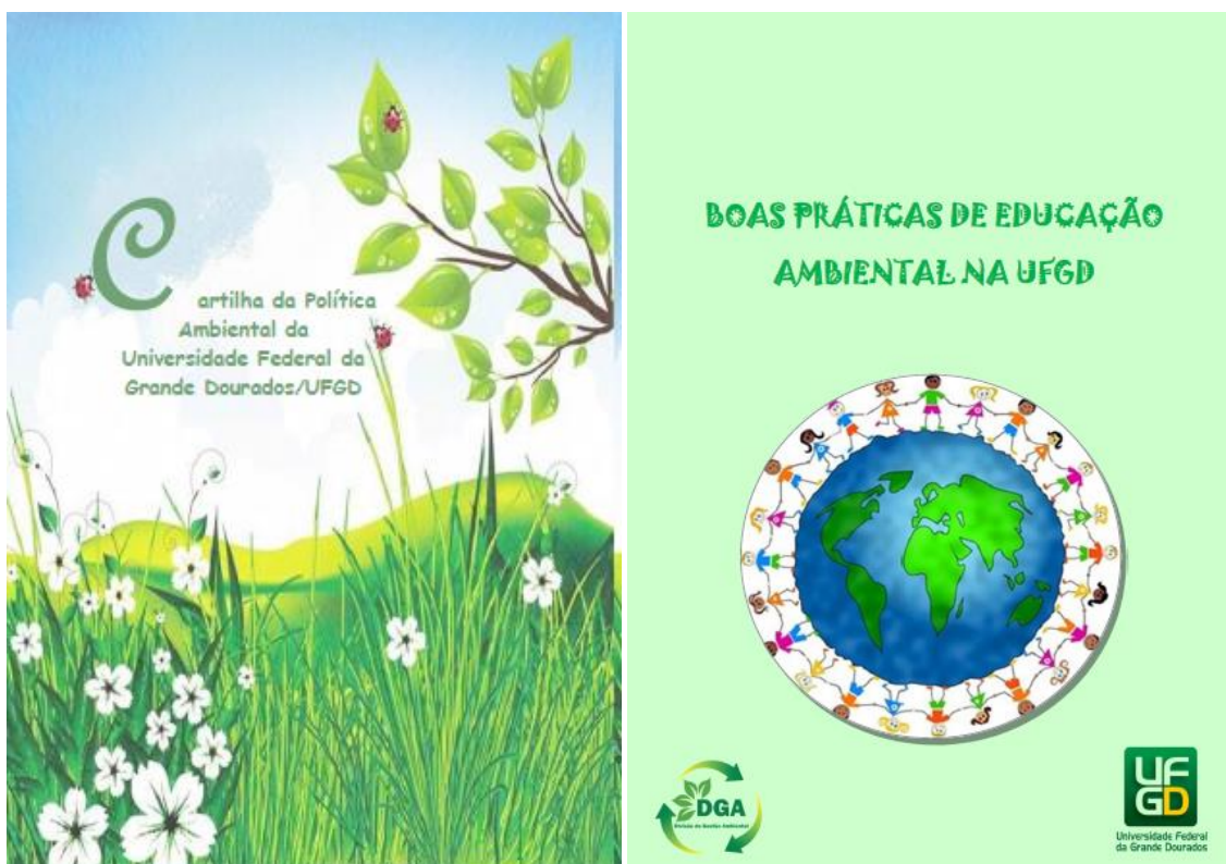
Figuras 6 e 7: Cartilhas de comunicação e educação ambiental.

Visando a sensibilização e a conscientização do cidadão sobre a responsabilidade socioambiental, foram elaboradas duas cartilhas, uma intitulada “Boas Práticas de Educação Ambiental na UFGD” (Figura 6) e outra “Política Ambiental da UFGD” (Figura 7).